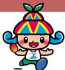
宮古島市イメージキャラクター「みーや」