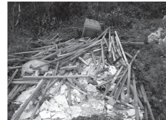
建築廃材などの産業廃棄物