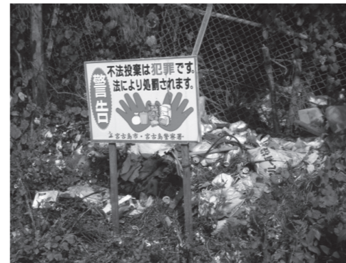
家庭から出たと思われる一般廃棄物

これは、環境モデル都市の形成に向け、環境保全に取り組んでいる宮古島市にとって大変残念な結果です。