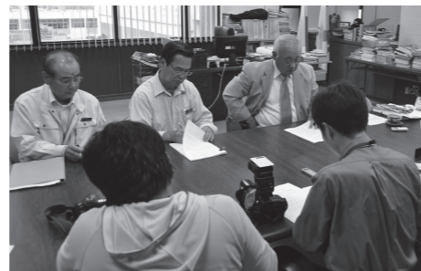
不法投棄撲滅宣言の様子